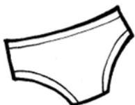
MUTANDE N° ...