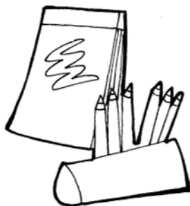
FOGLI E COLORI