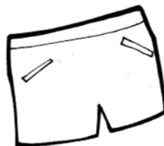
PANTALONCINI N° ...