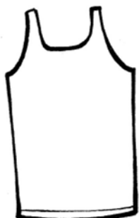
CANOTTIERE N° ...