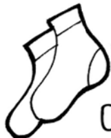
CALZE N° ...