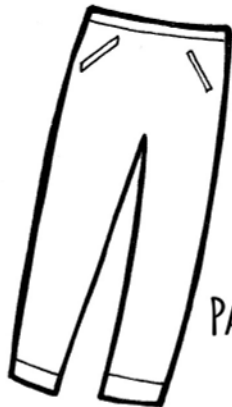
PANTALONI N° ...