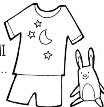
PIGIAMI N° ...