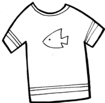
MAGLIETTE N° ...